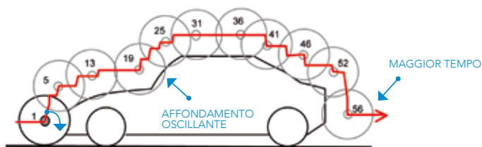
Copiatura discontinua a "scalini"