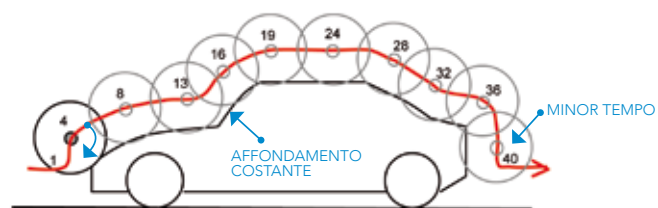
Copiatura continua vettoriale VectorPLus

Phoenix Tech ha implementato di serie il sistema Smart Touch : il profilo del veicolo è interpretato nel dettaglio per cui l'azione di lavaggio è fluida ed incrementa sensibilmente la qualità contraendo i tempi.